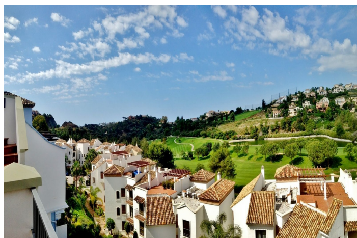
90 sq. mtrs. of rooftop solarium